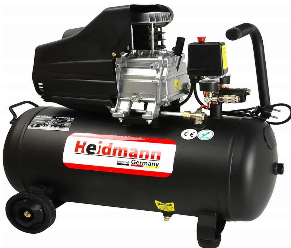
KOMPRESOR ULJNI 50L 8 bara HEIDMANN H00721

Jedan od najsnažnijih kompresora od 50 litara dostupnih na tržištu!