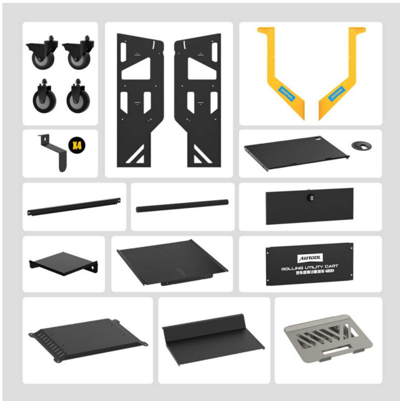
Okvir kolica T23 | 360° rotirajući stalak | 4-inčni tihi kotači | Sigurnosni remen za opremu | Bočne kuke za kabale | Set vijaka za montažu | Upute za montažu | Ladica s bravom